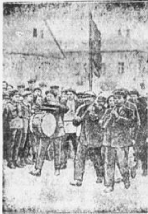
В еврейской деревне Ингулец украинскую группу делегации встретил оркестр из барабанов, скрипки и флейты.

Если пройти по полотну метров 400, то можно увидеть боль-