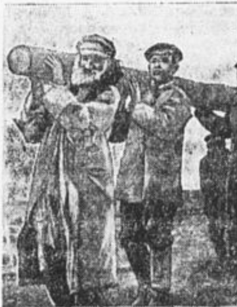
БССР. Старик и молодежь корчуют пни, таскают деревья.

Когда-то,—рассказывают переселенцы,—здесь была кровавая драка между окрестными крестьянами и переселенцами-евреями. А теперь так дружно живут, что крестьяне на выборах выдвигают в сельсовет кандидатуры евреев.