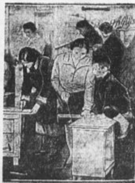
Будь готов к субботнику.

Мы сейчас участвуем в социалистическом соревновании. Мы помогаем партии и комсомолу бороться с прогулами, пьянством, мы боремся за трудовую дисциплину в школе. Пионерская организация сражалась и на культурном фронте. Каждый пионер—активный культурмеец в