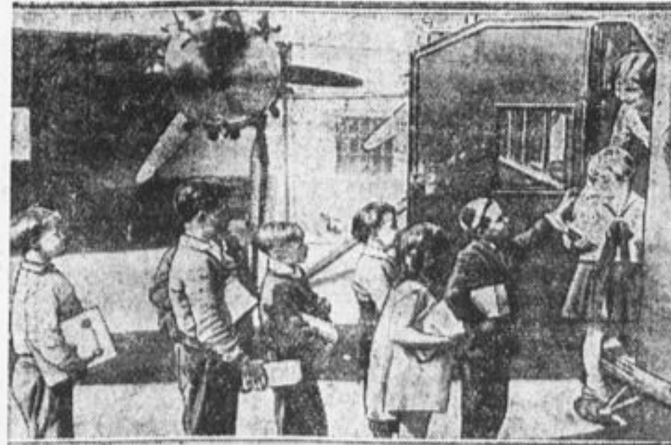
В Калифорнии дети изучают географию своей страны на аэро-плане.