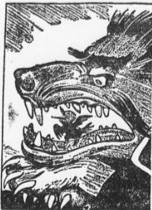
Вырвем из пасти кулака наших товарищей-батрачат.