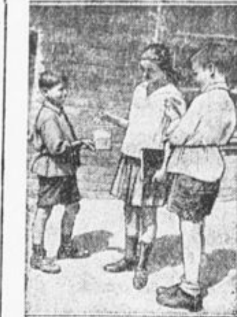
Кружечный сбор для оздоровительной кампании.