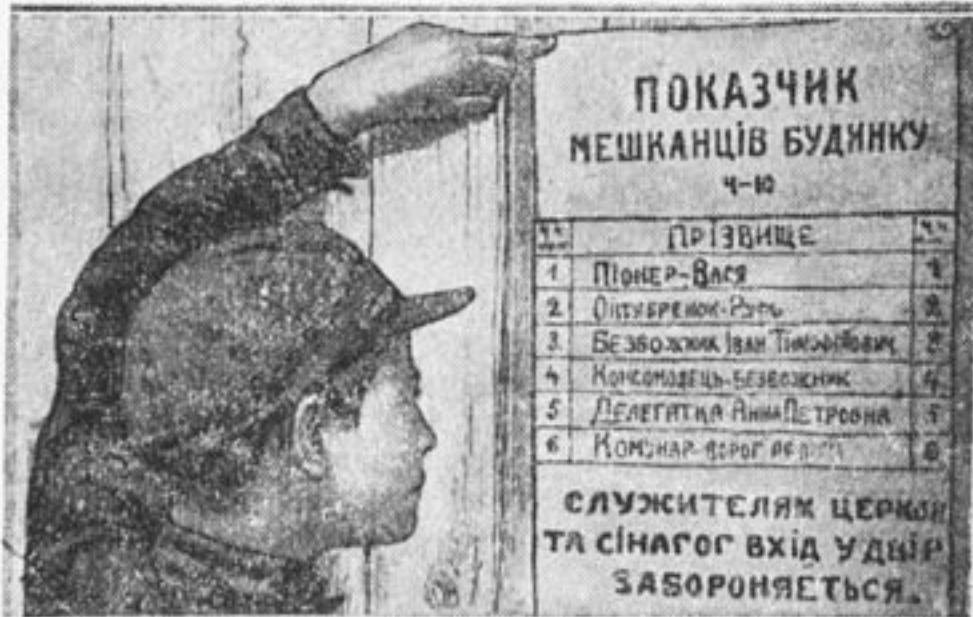
Табличка о живущих на доме в украинской деревне. На ней написано: сверху — указатель жильцов дома; снизу — «служителям церкви и синагог вход во двор запрещается».

ОТ РЕДАКЦИИ. Редколлегия должна добиваться, чтобы по каждой заметке в стенгазе учком, форпост или отрядный совет принимали меры. Иначе, грош цена всей критике стенгаза.