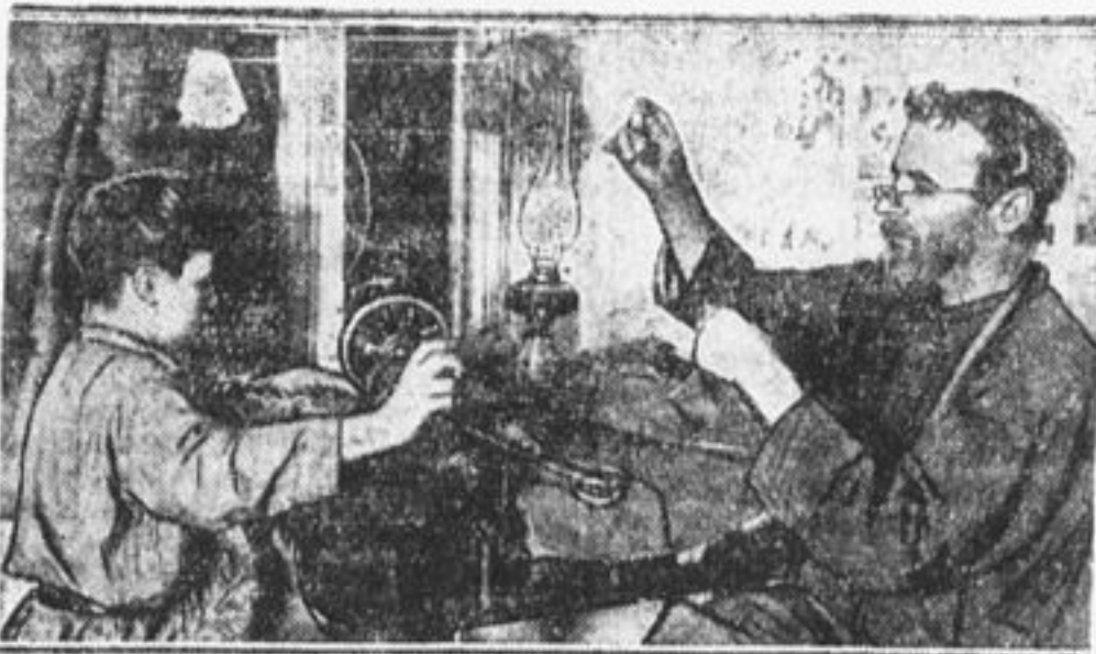
У деревенского портного.